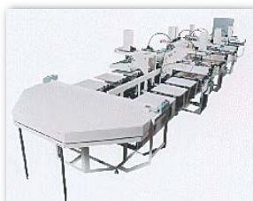
Tシャツ自動印刷機