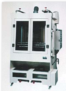
スクリーン版インキ自動洗浄装置