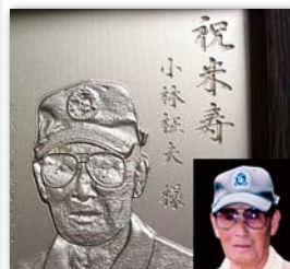
写真からのレリーフ製作例 ②