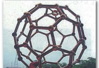
ボールジョイントによる立体構造物