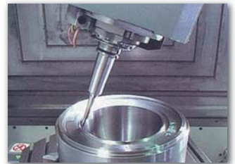
5軸加工機で工程短縮を!