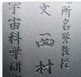
文字からの史文例