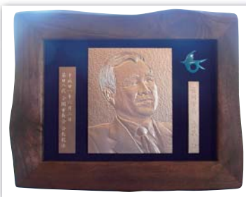
写真からのレリーフ製作例 ①