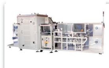
Roll to Roll装置