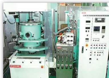
放電プラズマ焼結装置