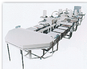
Tシャツ自動印刷機