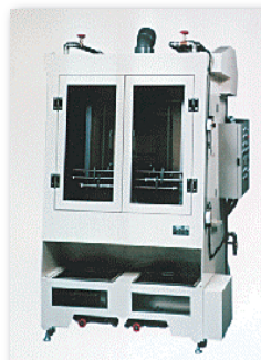
スクリーン版インキ自動洗浄装置