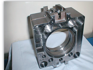
旋削マシニングの組み合わせ加工例 (焼入部の旋削を含む)