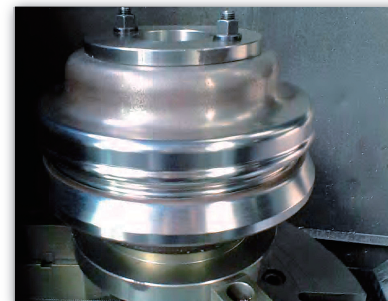
立旋盤による加工例 (フォーミングローラーの外形修正)