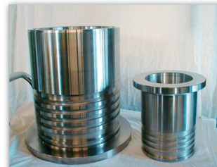
工作機械主軸用ベアリング冷却用スリーブ 旋削加工例(ラセンのピッチ22mm、溝幅12mm)