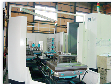
横型マシニングセンタ a81-6パレット仕様 (牧野フライス製作所)