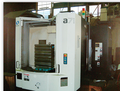
横型マシニングセンタ a71 (牧野フライス製作所)