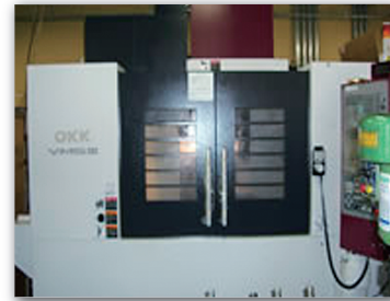
マシニングセンター VM5 (OKK)