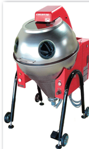
バイク・自動車部品表面処理用ウェットブラスト装置ココット