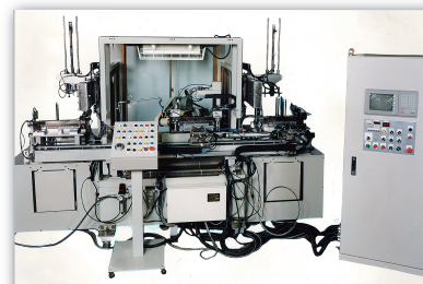
鋸及び各種刃物の全自動刃付け機

(株)中屋、日本精機(株)、(株)東京島津、(株)大原鉄工所、(株)齋国製作所、(株)ニイプロ、その他