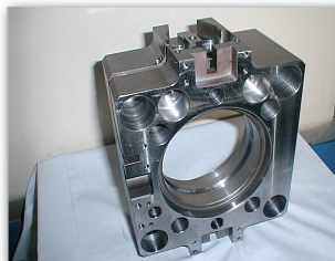
旋削マシニングの組み合わせ加工例 (焼入部の旋削を含む)