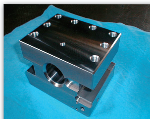
フライス、マシニング加工例 (中心穴と溝との割芯度0.01以内)