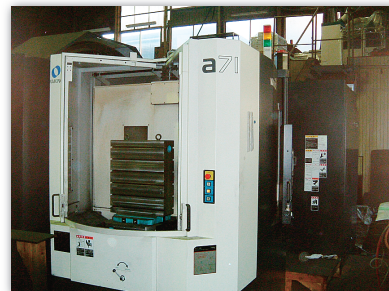
横型マシニングセンタ a71(牧野フライス製作所)