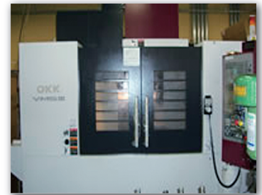
マシニングセンター VM5(OKK)