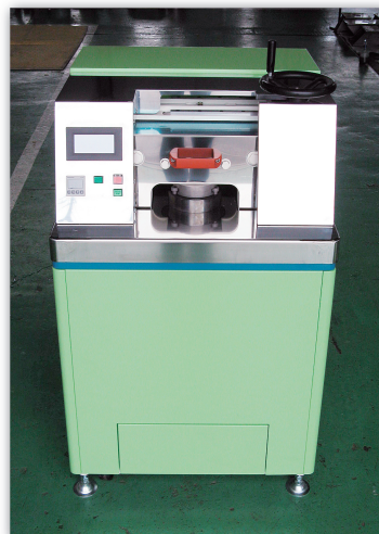
高圧装置(自社製品) みずっこパワー(SHP-100-5)