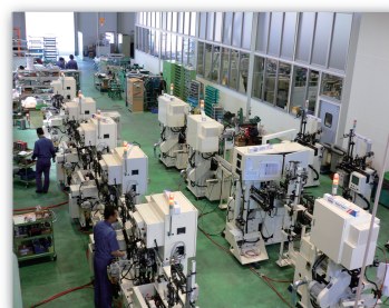
自動車部品研削ライン