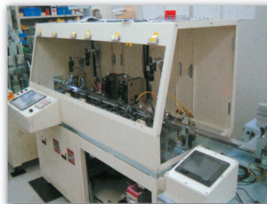
フォーミング装置